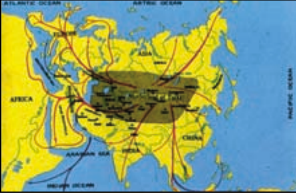
Göçler ve Türkler

"Buradan çekik gözlü gittiniz, çakır gözlü döndünüz" dedi. Doğru bir tespit. Aramızda mavi gözlüler çok olmasa bile vardır. Mühim olan mavi gözlü olmak değil de, gözlerimiz çekikken değişmiş olması. Çünkü, yol boyu rastladıklarımızla, yoldaşlarla, Anadolu'da yerleşenlerle karıştık. Biz aslında, kültür Türküyüz, ırk Türkü değil. Bir Japon eğitimci bana dönüp "bu kadar çeşitli milleti nasıl yönetiyorsunuz" diye sordu. "Yönetiyoruz ama sen bir de bize sor, hiç kolay değil, çok çeşitli milletler var, biz o çeşitli milletlerden bir millet yaratmaya çalışıyoruz, çok yüce bir gayret" dedim. Avrupa Birliği'nin çok kültürlülüğün peşinde olduğunu biliyor musunuz? Kurmak istedikleri birliğin tek değil çok kültürlü olmasını istiyorlar. Biz, o çok kültürlülüğe sahibiz ve bizi kabul etmesi için Avrupa'nın peşinden koşuyoruz. Biz şimdi o çok kültürlülüğten bir ulus yaratmaya çalışıyoruz. Kafamda bütün bu sorular dalga dalga dolanıyor.