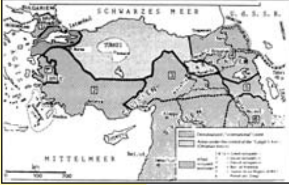
Sevres Antlaşması'na göre Türkiye (1920)

Fransızca hem de Türkçe yazıyor. 4-5 cilt kitabı var, Selçuklu tarihi konusunda. Anadolu'nun Türkleşmesinin belki ilk 200 yılı Selçuklu döneminde geçiyor. 1071'den Osmanlı'nın kuruluşu olan 1300'lere kadar olan dönemi ele