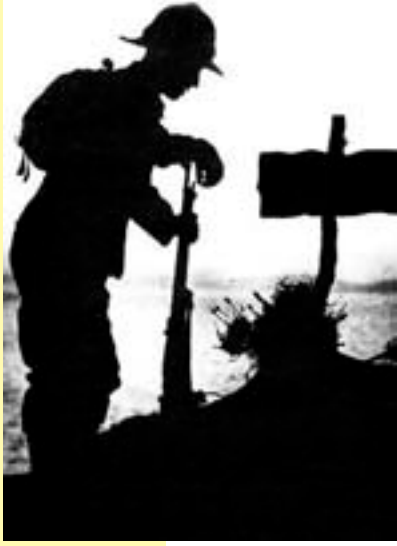
Çanakkale'ye veda eden bir Anzak.

görüşümüz alınıyor ve yapılan hesaplamalarda ülke olarak dikkate alınıyorsa, bunlar Atatürk'ün bize kazandırdığı bağımsız devletimiz sayesinde. Bu devletin ortaya çıkması kolay olmamıştır. Türkiye Cumhuriyeti'nden önceki devletimizin son zamanlarına dikkatlice bir göz atarsak, bağımsızlığın ve milli devlet olmanın gereklerini yerine getiremediğini açık ve net bir şekilde görebiliriz. Bağımsızlıktan anladığımız da, ekonomik olarak dışarıya