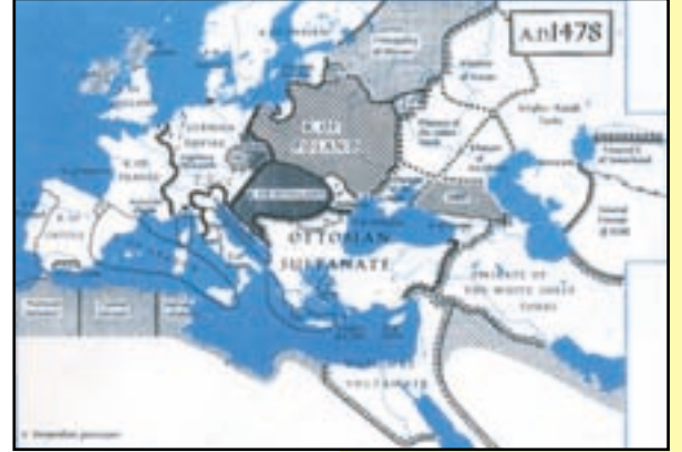
MS 1478 Osmanlı-Akkoyunlu-Memluk