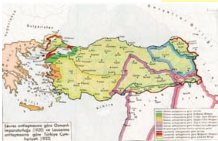
Sevres Antlaşması'na göre Osmanlı İmparatorluğu (1920) ve Lousanne Antlaşması'na göre Türkiye Cumhuriyeti (1923)