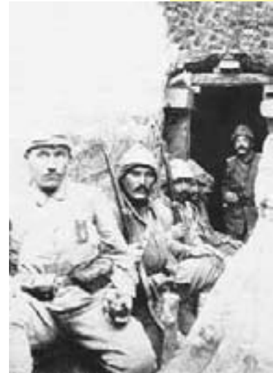
Çanakkale Savaşı'nda siperdeki Türk askerleri