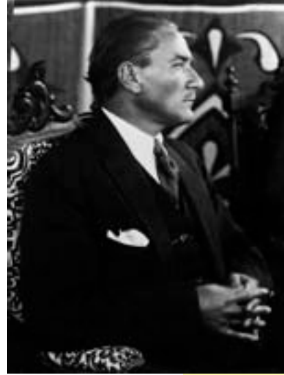
Mustafa Kemal Atatürk Kültür devrimcisi, yeni bir Türk insanı yaratılması fikrinin mimarı ve uygulayıcısı.

Atatürk, bir İngilizin yazdığı "Outline of History" adlı kitabı tercüme ettiriyor ve bu kitapta şu kişilerle tanışıyor. Bu kitapta filozof Locke; "İnsan dünyaya insan olarak gelmedi, eğitimle insan oldu, sadece anne babası insan olduğu için değil. İnsan beyni dünyaya tertemiz bir çekmece veya bal mumu gibi geldi" diyor. Bizim pek iyi